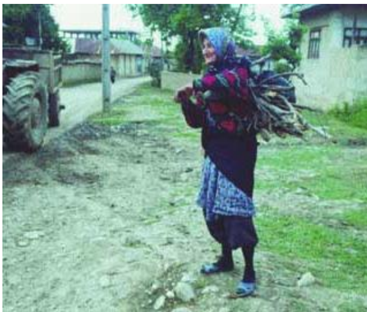
تصویر، زنی را نشان می‌دهد که از یک چشم نابیناست و برای افراد خانواده خود، هیزم جمع‌آوری می‌کند.

می‌کنند. ۹ نفر نیز از طریق کسب و کار کشاورزی درآمد دارند و ۲ نفر باقی‌مانده هم در استخدام نهادهای دولتی بودند (جدول شماره ۱). همچنین مشخص شد که ۱۰ نفر از معلولان مورد مصاحبه از نظر مالی به وسیله بانک کشاورزی و ۳ نفر از طریق دیگر بانکها حمایت اعتباری شده‌اند، در حالی که باقی افراد از چنین کمک‌هایی برخوردار نشده بودند.