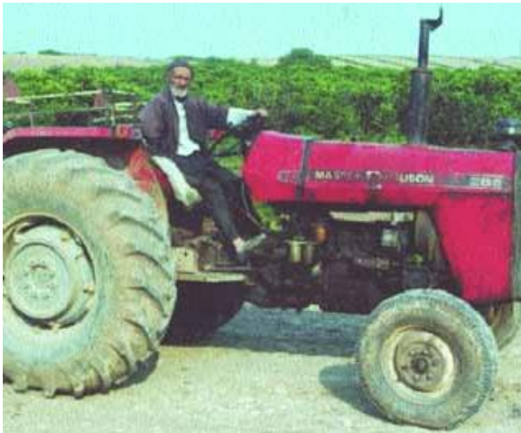
تصویر، کشاورز مسنی را نشان می‌دهد که یک دستش را از دست داده است و تقریباً همه فعالیت‌های کشاورزی خود را با تراکتور انجام می‌دهد.

درخصوص این امر که نهادها و ارگان‌های ذی‌ربط باید زمینه را برای کمک به افراد معلول در انجام فعالیت‌های مختلف کشاورزی فراهم آورند، اغلب