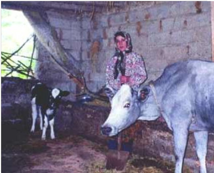
تصویر زن کشاورز نیمه فلجی را نشان می‌دهد که در اصطبل خانه‌اش به کار پرورش گاو مشغول است.

در مورد سطح سواد ۲۴ خویشاوند مورد مصاحبه که ۱۸ نفر آنان مرد و ۶ نفر بقیه زن بودند، معلوم شد که ۸ نفر بی سواد، ۷ نفر در حد آموزش ابتدایی، ۶ نفر در حد راهنمایی؛ ۲ نفر در حد دبیرستان و یک نفر هم دارای تحصیلات دانشگاهی است. در مورد نسبت خویشاوندی افراد مورد مصاحبه لازم به ذکر است که ۴ نفر از آنها پسر، ۶ نفر همسر، ۶ نفر برادر و ۸ نفر پدر افراد معلول بودند.