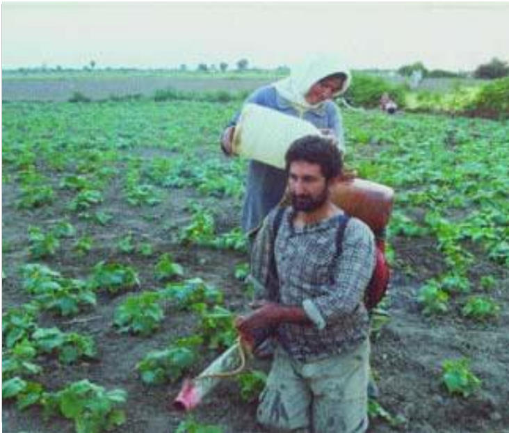
تصویر، یک کشاورز معلول و همسرش را نشان می‌دهد که بدون رعایت نکات ایمنی، در حال آماده کردن سمپاش برای سمپاشی مزرعه خود می‌باشند.

کشاورزان معلول را تشخیص داده و قبول دارند؟ در ارتباط با این پرسشها، شایان ذکر است که اگر افراد معلول از حقوق قانونی خود در مورد خدمات آموزشی - ترویجی آگاه باشند، باید در به دست آوردن چنین خدماتی اهتمام ورزند. اگر متخصصان و کارشناسان ترویج هم افراد معلول را گروه هدف ویژه آموزشهای خود می‌دانند، باید از هیچ کوششی برای خدمت به این گروه، مطابق با شرایط ویژه آنان، فروگذار نکنند.