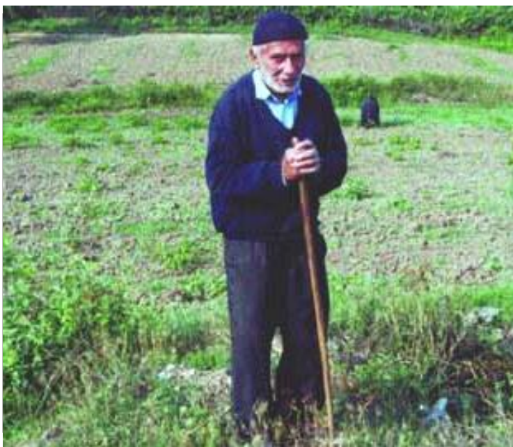
کشاورز سالخورده‌ای (با مشکل ناشنوایی) که به عنوان یک مدیر فعال در روستا مشغول به کار است.