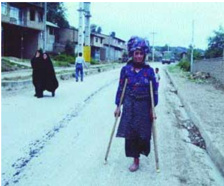
تصویر، یک زن معلول را نشان می‌دهد که در حال حمل غذا بر روی سر برای اعضای خانواده خود است که در مزرعه کار می‌کنند.

اغلب مصاحبه شوندگان، تهیه ادوات و نهادها و اعطای وامهای کم بهره را بهترین تسهیلات اقتصادی در کمک به حل مشکلات و دشواریهای کشاورزی عنوان می‌کردند.